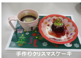
手作りクリスマスケーキ